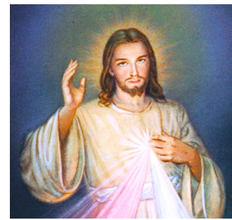
Dimanche de la Divine Miséricorde 12 avril

« LA LETTRE » sera projeté et débattu dans le cadre de la démarche Église Verte initiée par les paroissiens du secteur des Collines : LUNDI 18 MAI À 20H au sanctuaire du Pech