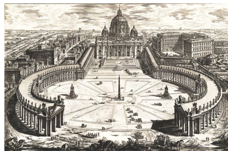
Basilique et Place Saint-Pierre, Giovanni Battista Piranesi, c.1760

Veillée de prière ÉVEILLEZ-VOUS Samedi 24 Mai, 20h30, chapelle ND du Pech