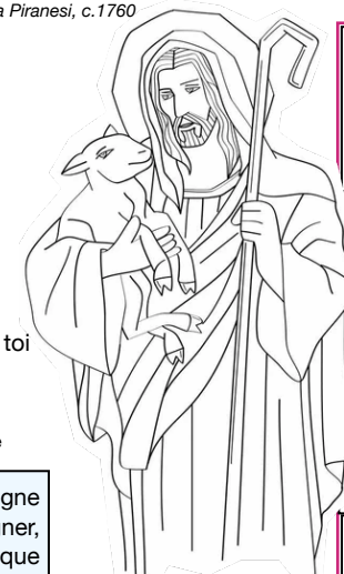
Représentation de Jésus Bon Pasteur

Secrétariat paroissial fermé les vendredis 9 et 30 mai