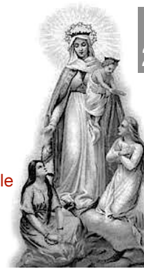
Notre Dame libératrice Montligeon